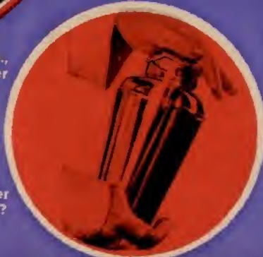
Was mixte der Mixer später?

Sehr viel Zeit für Affären kann der Hoheit von Hollywood, wie man Joan Crawford gerne nennt, zwischen den Ehen eigentlich gar nicht geblieben sein. Im Grunde war sie laufend verheiratet, wenn auch nicht mit ein und demselben Mann. Dreimal waren es Schauspieler, zwei davon sind sehr bekannt, und jetzt soll ein Industrieller der letzte Ehemann sein. Bei der Industrie fühlt man sich so schön geborgen.